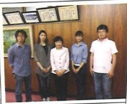
地域おこし協力隊の 皆さまと (山口市徳地)