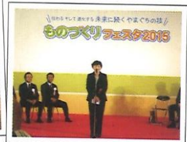
ものづくりフェスタにて