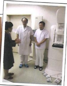
乳がん検診の 現場へ