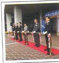
ビジネスメッセにて テーブルカット