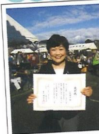
地域の皆様より 表彰状を