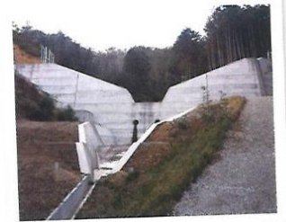
さほうえんてい 砂防堰堤整備