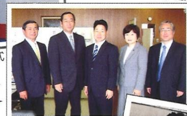
5人になった公明党県議団