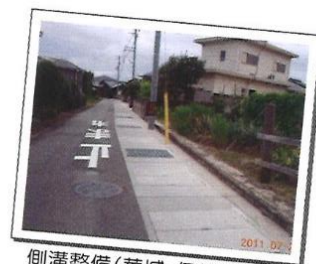
側溝整備(華城・伊佐江)