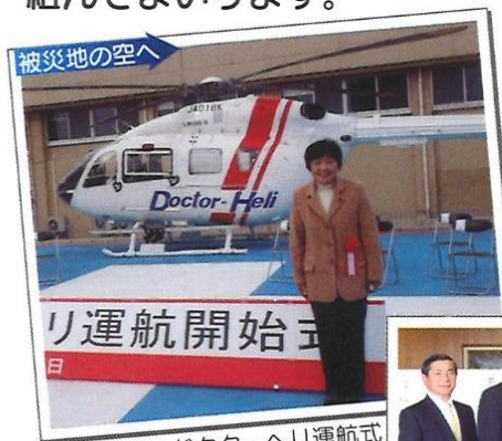
H23.1.22 ドクターヘリ運航式