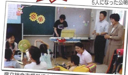
県立総合支援学校を視察